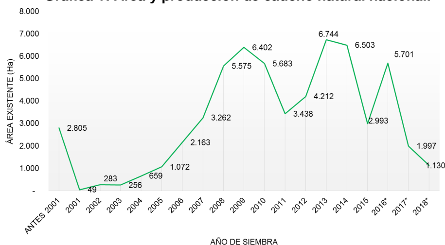
Gráfica 1: Área y producción de caucho natural nacional.

Colombia ha aumentado el área sembrada con miras a aprovechar el potencial del país para el crecimiento del sector, ya que se disponen de más de cinco millones de hectáreas para la siembra de caucho en todo el territorio, según el estudio de zonificación realizado por la UPR. Es así, como en los últimos diez años se sembraron 45.000 hectáreas que le permiten sumar hoy cerca de 64.000 hectáreas de caucho apoyado por el Gobierno Nacional a través del Ministerio de Agricultura y Desarrollo Rural, la cooperación Internacional y recursos propios, en los años recientes, sin embargo, el ritmo ha disminuido como consecuencia de la caída de los precios globales. El comportamiento de las siembras anuales se muestra a continuación: